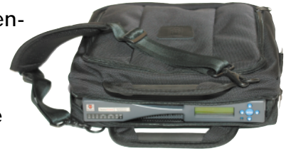
QualysGuard Intranet Scanner facilite les scans de vulnérabilités internes de manière compétitive.

QualysGuard Consultant permet aux consultants en sécurité de réduire la durée de leur intervention sur site en conduisant des évaluations à distance des réseaux, de manière plus efficace et précise grâce à un service Web performant et facile à déployer.