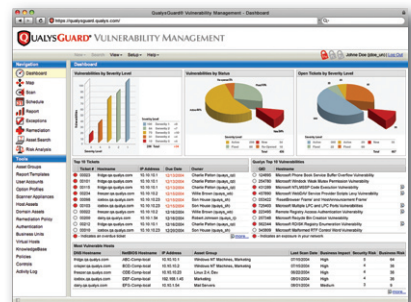
Tableau de bord personnalisable par utilisateur

Pour plus de détails, rendez-vous sur le site www.qualys.com