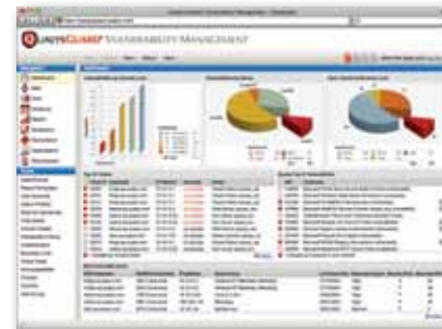
Tablero de control personalizable por usuario

Visite www.qualys.com si desea más detalles.