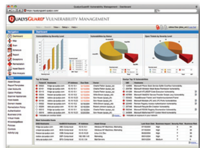
Anpassbares Dashboard für jeden Benutzer

Nähere Informationen finden Sie unter www.qualys.com